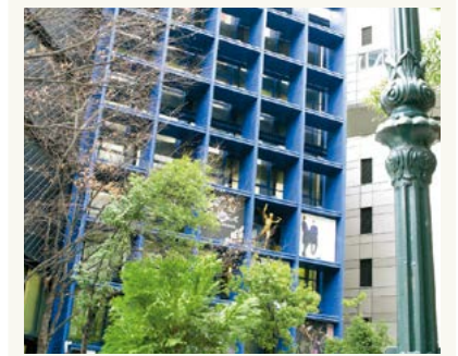
ジーニアスギャラリー

醸し出す、懐かしい、けれど新しい表情を生かしながら多彩な個性を持つ店舗展開は今では65ブランド&ショップ(2014年5月現在)に至り、町の歴史に新たな時代の息吹を吹き込んでいます。