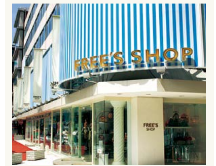
フリーズショップ

ショップデザイン、環境も路面なら思い切ったことができることから、話題性のある店舗が次々と集まり、現在では21ブランド&ショップ(2014年5月現在)を展開しています。