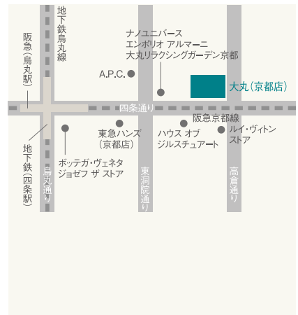
大丸京都店周辺店舗

こうした神戸・心齋橋・京都での周辺店舗開発を通じて培ってきた取り組みノウハウを、今後グループレベルで推進していく「地域とともに発展するビジネスモデル構築」に繋げていきたいと考えています。