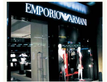
エンポリオ アルマーニ