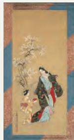
《桜花遊女と桃図》菱川師宣筆 氏家浮世絵コレクション蔵