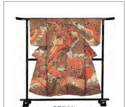
重要文化財 染分縷子地御所車花鳥文様縹縮小袖 (江戸時代初期)