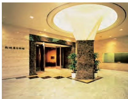
松坂屋美術館 エントランス(松坂屋名古屋店 南館7階)