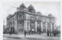
1910年、栄町に新築開店した名古屋店