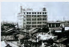
1922年、第1期工事が完成した大阪店