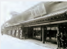
1914年、大阪初登場となった大阪店のショーウィンドウ