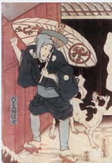
大丸名物となった借傘は浮世絵にも画かれた