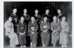
業界初の制服(きもの)を着た女性たち