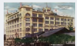
現在地である南大津町(当時)に移転した名古屋店