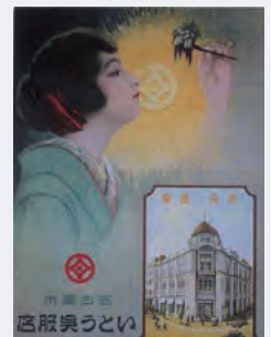
いたう呉服店のポスター