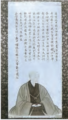
創業者・下村彦右衛門正啓