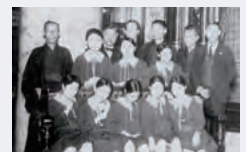
上野店のエレベーターガールたち