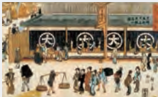
歌川広重が画いた大伝馬町の江戸店