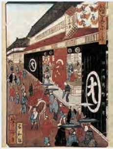
1726年に開店した大阪店