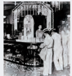
百貨店で初めて土足入場を実施した銀座店の店内風景