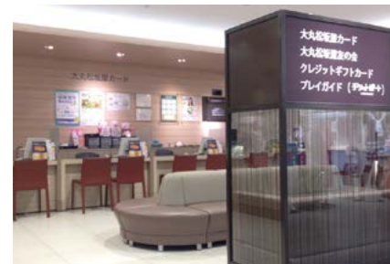
大丸東京店「カスタマーカウンター」

このように各種クレジットカードの発行を通じて、顧客固定化を推進することにより、百貨店事業の売上向上をはかるとともに、そのカードが生活の幅広い場面でお使いいただける利便性を提供することにより、クレジット事業の発展にも寄与していきます。