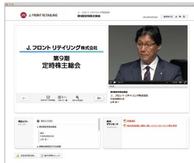
株主総会の模様をウェブサイトで配信（録画）

また、第9期株主総会から会場での「事業報告」説明部分を録画でオンデマンド配信しています。