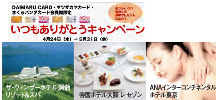
①母の日に合わせ、女性向けの“贅沢体験”をプレゼント