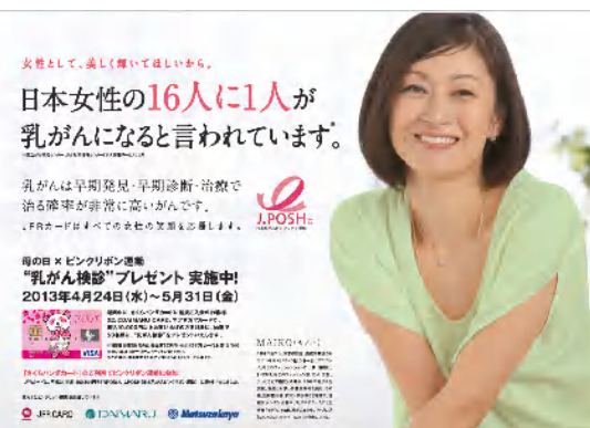
③MAIKOさんをイメージキャラクターにした啓発ポスター

④“ピンクリボン運動”を応援する暖かい気持ち を込めた「ハートパン」 ベーカリーコーナー「ポールボキューズ」で販売。