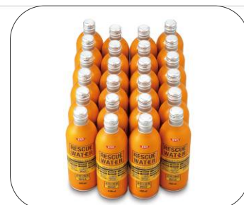
非常用飲料水 3,465 円 (税込み)

年末・年始の食卓にも便利なお自宅使用限定の商品を特集。百貨店ならではの高質な商品をお買得価格で提供します。話題のご当地取り寄せグルメ、サイズ不揃いなどのワケあり食品、缶詰や飲料水など非常食としても活用できる長期保存用食品、まとめ買い用食品を提案します。特に 長期保存食品は、来年 4 月に消費増税を控えていることから、お客様の関心が一層高まると予想 しています。