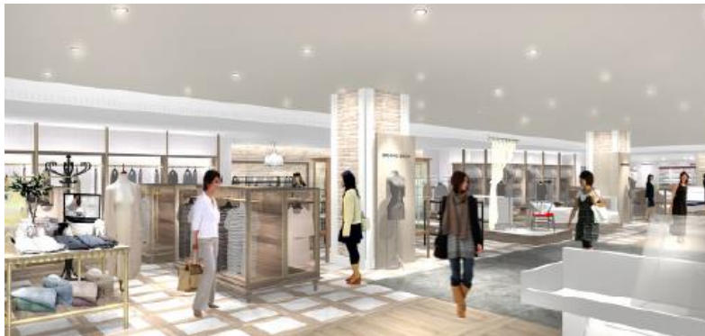
寝具ナイトウェア売場 イメージ

タオル・バス売場では、素材や織りにこだわり、シンプルでありながらも、どこかしらエレガンスを感じさせる上品なタオルを「大丸神戸ベーシック」として集積します。