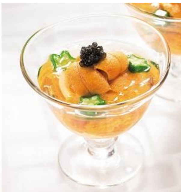
〈函館うに むらかみ×セレビア〉 無添加生うにのフレッシュキャビア添え 税込 24,840 円（本体価格 23,000 円）