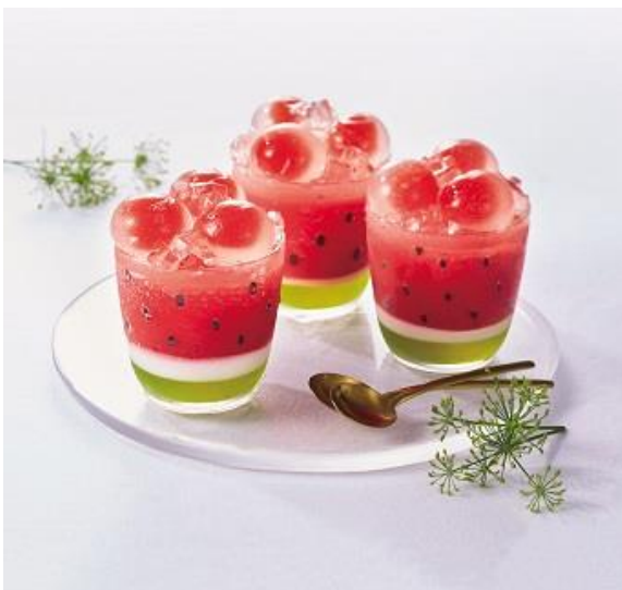
〈ケーキハウス ショウタニ〉粋夏ゼリイ 税込 4,860 円 (本体価格 4,500 円)

箱を開ける瞬間の胸の高鳴りや愛らしいビジュアル、後引くおいしさ。テーブルを囲む楽しい時間に贈りたいギフトを揃えました。