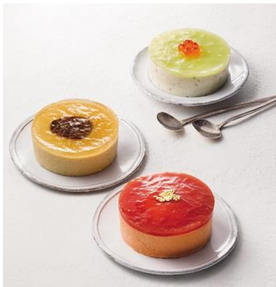
〈銀座カンセイ〉カンセイ流フレンチムース3種 税込 5,400 円（本体価格 5,000 円）