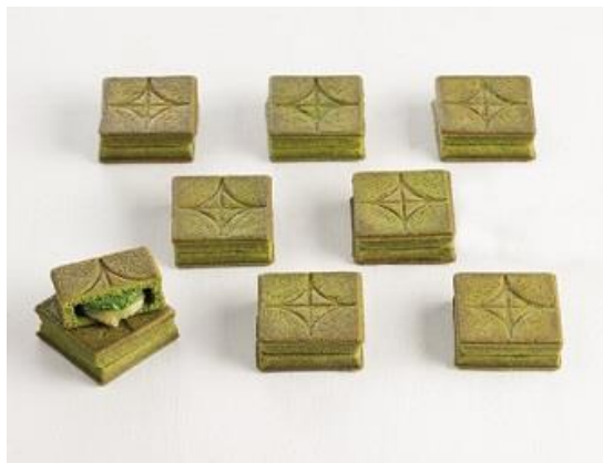
〈PRESS BUTTER SAND〉バターサンド〈宇治抹茶〉 9 個入 税込 2,070 円（本体価格 1,917 円）