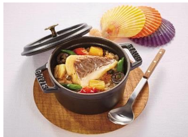
〈38deri〉アクアパッツァ鯛めし 160168 税込 5,400 円 (本体価格 5,000 円)