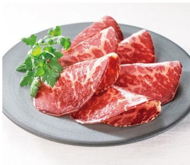
〈肉のふがね〉岩手短角和牛 長期熟成無添加 生ハム（セシーナ） 税込 9,936 円（本体価格 9,200 円）