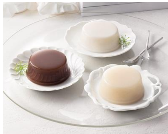
〈本高砂屋〉甘酒涼菓詰合せ 税込 3,240 円（本体価格 3,000 円）