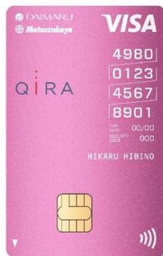
大丸松坂屋カード

・これまでの横型の大丸松坂屋カードから大きくデザインのリニューアルを行いました。業界初となる縦型のカードデザインは Visa のタッチ決済も導入し、カード番号も4桁4段の分かりやすい表記を採用したほか、カードカラーもシンプルで上質さを感じる色合いを目指しました。