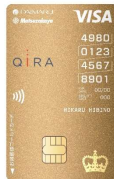
大丸松坂屋 お得意様ゴールドカード