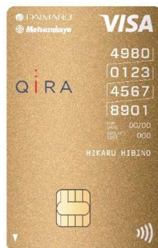
大丸松坂屋 ゴールドカード