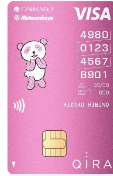
さくらパンダカード