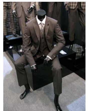
enter G (エンタージー)

【新規】 マッキントッシュ フィロソフィー 9月2日(木)オープン 英国を代表するアウターウェアブランド・マッキントッシュ。そのセカンドラインとして誕生したこのブランドは、マッキントッシュの持つ上質なモノづくりの精神とクラシック&コンテンポラリーな美意識を引き継いだトータルコレクションです。