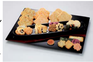
京都・宇治式部郷(きょうと・うじしきぶのさと)

京都・宇治式部郷は、菓子の世界に源氏物語の雅を表現しました。こだわりの厳選された素材を使用し、上品な味・かたちに仕上げた彩り豊かなおせんべい・おかき。包装紙やパッケージは、源氏物語の世界を写し、雅やかな平安の物語の語り部として感動をお伝えします。