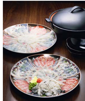
とらふぐ 刺身・しゃぶ鍋セット (税込 21, 000 円)

◆集いのまん中に。歓声を呼ぶ絶品鍋 冬の味覚の王様、下関のふぐ。さしみはふぐ刺しで、 しゃぶしゃぶは特製ダシにさっとぐらせていただく しゃぶ鍋セット。