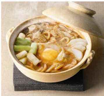
「山本屋総本家」 なまみそ煮込みうどん土鍋詰合せ (税込 5, 250 円)