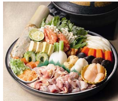
大阪「今井」うどん寄せ鍋2人前 (税込 9, 450 円)