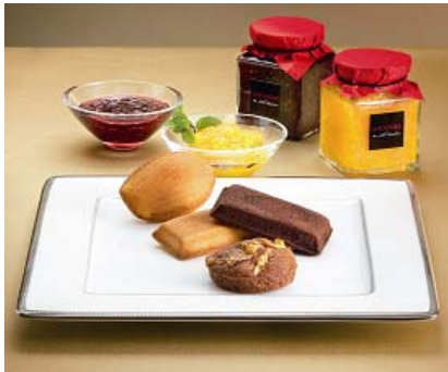
ジョエル・ロブション ジャム&焼き菓子 (税込 5, 145 円)

◆素材との対話から生まれる、感動の味 フレンチの巨匠、ジョエル・ロブション監修のもと 厳選された素材を使った特製のコンフィチュール と焼き菓子のセット。