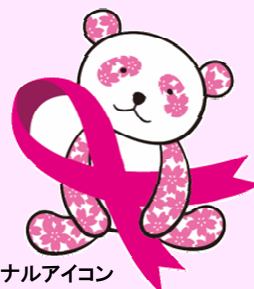
ピンクリボンキャンペーンオリジナルアイコン

また、幅広い年代の女性に人気のさくらパンダ(当社キャラクター)を使ったピンクリボンキャンペーンのオリジナルアイコンを店頭POPなどに活用し、女性の関心を引き付けます。