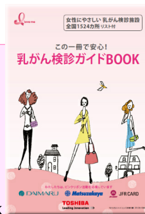
乳がん検診ガイドBOOK

マンモグラフィ検診や超音波検査、セルフチェック方法など乳がん検診に関する詳しい情報や、マンモグラフィ検診施設(全国1,524カ所)を紹介しており、約40ページにわたる充実した内容です。