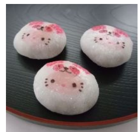
大福 (3個入) 525円