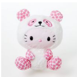
マスコットホルダー 1260円