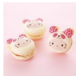
マカロン (3個入) 683円