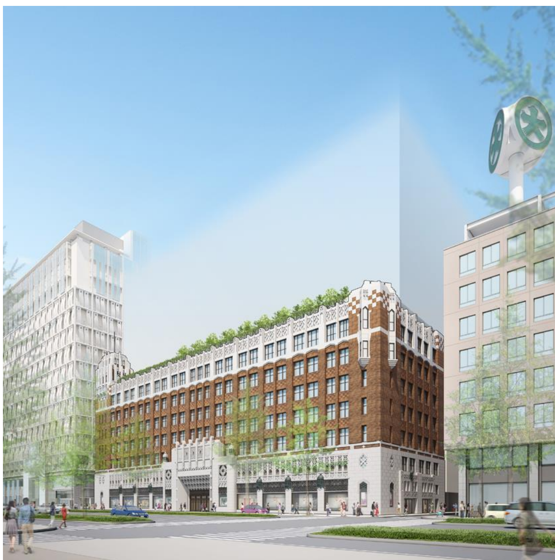
外観イメージ（御堂筋南西より）

また、新築部も保存部とのバランスを考慮し御堂筋沿道の景観として相応しいデザインとします。