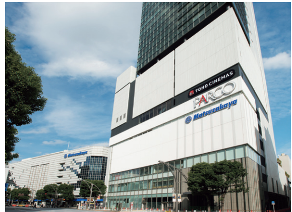
上野フロンティアタワー・PARCO_ya (2017年11月開業)