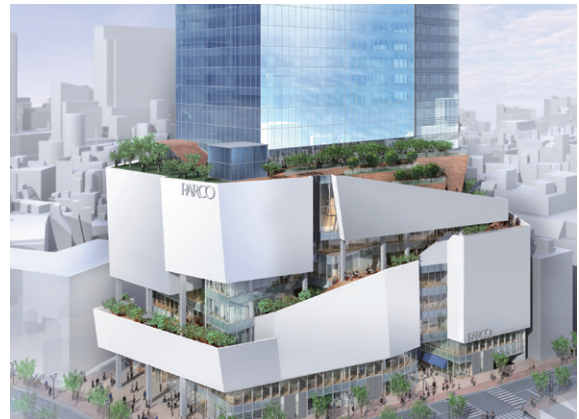
渋谷PARCOを含む宇田川町15地区開発イメージ (2019年秋 建替えオープン予定)