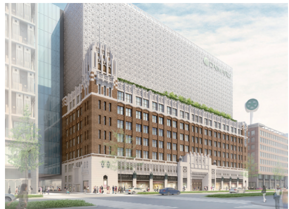
大丸大阪・心齋橋店本館完成予想図 (2019年秋 本館建替えオープン予定)