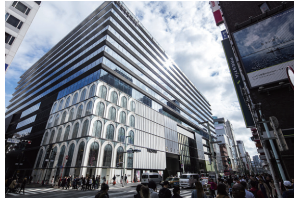
GINZA SIX (2017年4月開業)