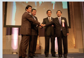
2007年9月 J.フロントリテイリング(株)を設立