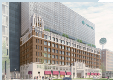
2019年9月 大丸心齋橋店 新本館 完成予想図