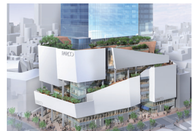
2019年11月 渋谷 PARCO イメージ