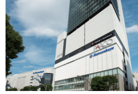
2017年11月 上野フロンティアタワー 開業