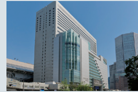
2011年3月 大丸梅田店増床オープン