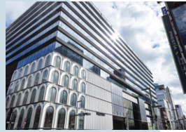
2017年4月 GINZA SIX 開業